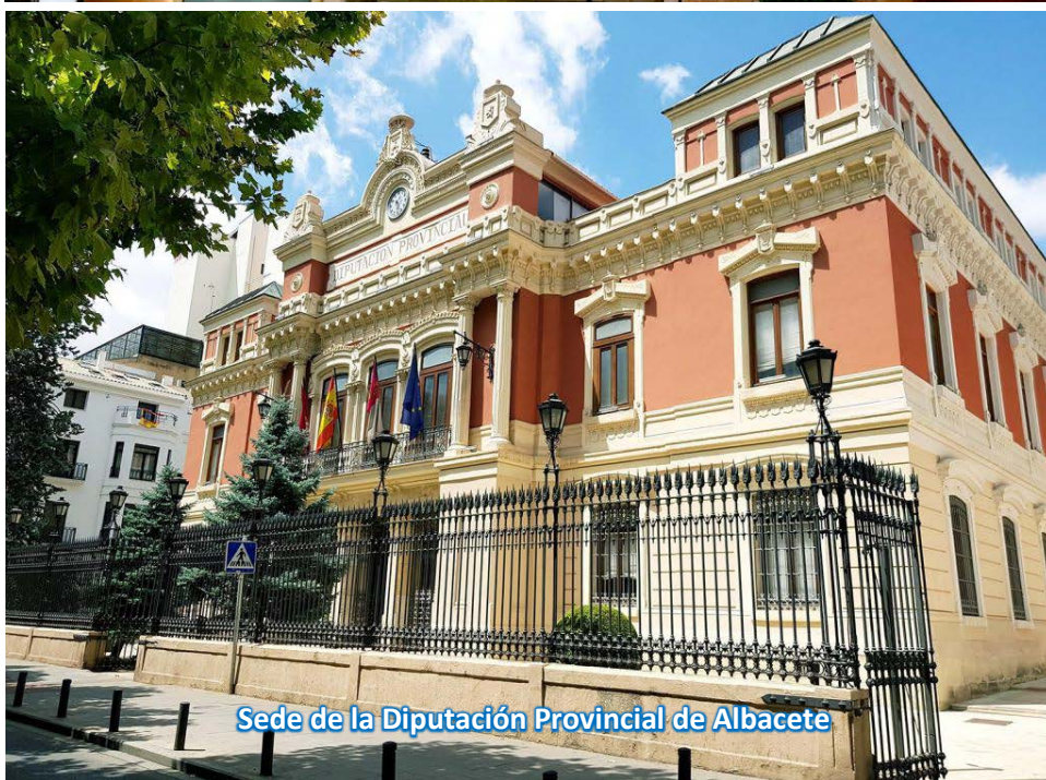
Sede de la Diputación Provincial de Albacete